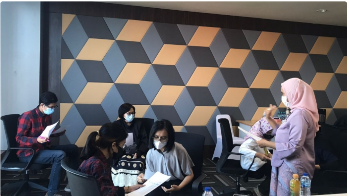
Satgas PPKS UNAIR dalam kegiatan Pelatihan Penanganan Korban Kekerasan Seksual pada Jumat (23/9/2022) di ASEEC Tower UNAIR.