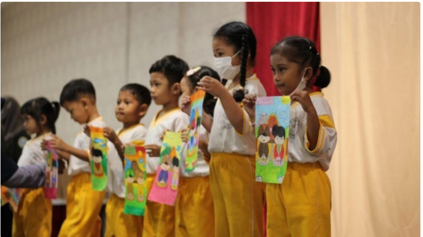
Siswa binaan SCOLAH UNAIR menunjukkan hasil karya mereka didepan panggung

SURABAYA – Perkembangan zaman membuat perubahan besar. Salah satunya pada sektor pendidikan. Orang tua hendaknya memiliki strategi dalam mendidik anak agar tidak terlarut dalam dampak negatif dari era digital.